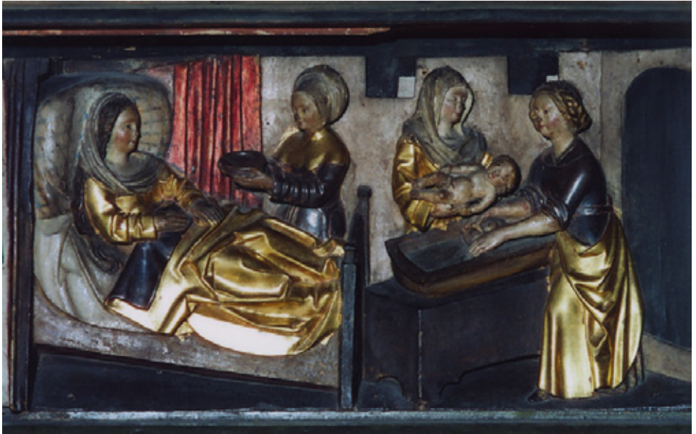
Mariengeburt - Hagelsheimer Altar - Jakobskirche in Nürnberg