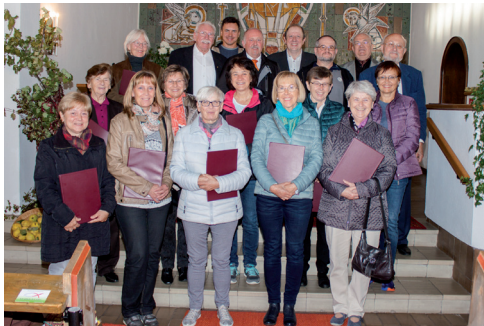
Gesang- und Musikverein